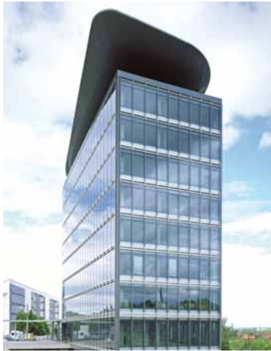
■ Bülow Bogen Stuttgart Flugdach