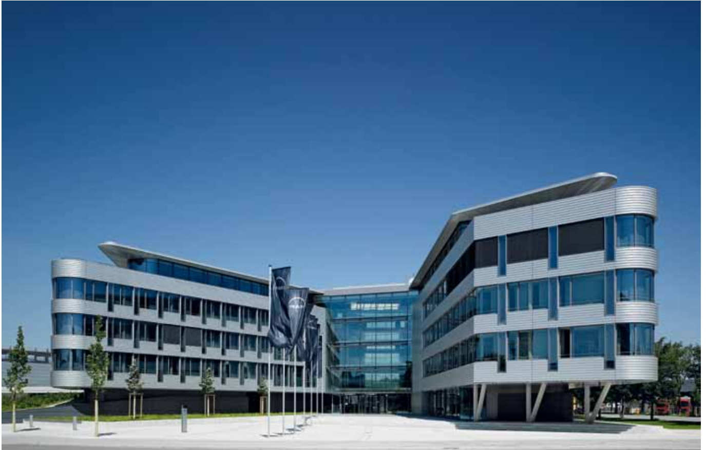
■ MAN Firmengebäude München