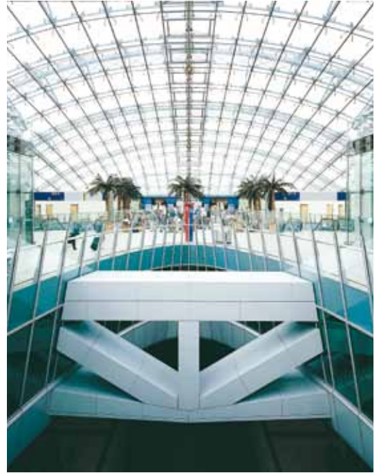
■ ICE-Fernbahnhof Frankfurt a. M.