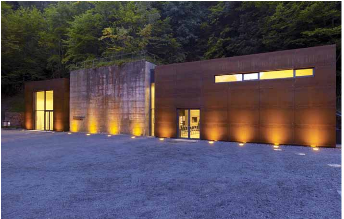
■ Regierungsbunker BadNeuenahr-Ahrweiler Fassade aus Cortenstahl