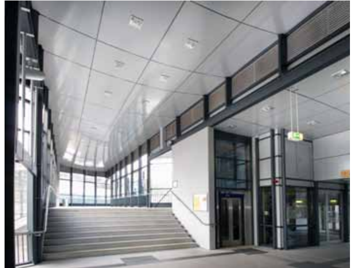
■ Bahnhof Wissen Deckenverkleidung

Zu unserem Kundenkreis gehören viele sehr bekannte und noch mehr weniger bekannte Unternehmen. Für uns sind alle gleich wichtig. Und alle profitieren sie von unserer Fertigungstiefe und unserem individuellen Service – von der Planung im Vorfeld bis zur Ausführung. Dies gilt für Großprojekte, aber in gleicher Weise auch für kleinere Bauvorhaben.