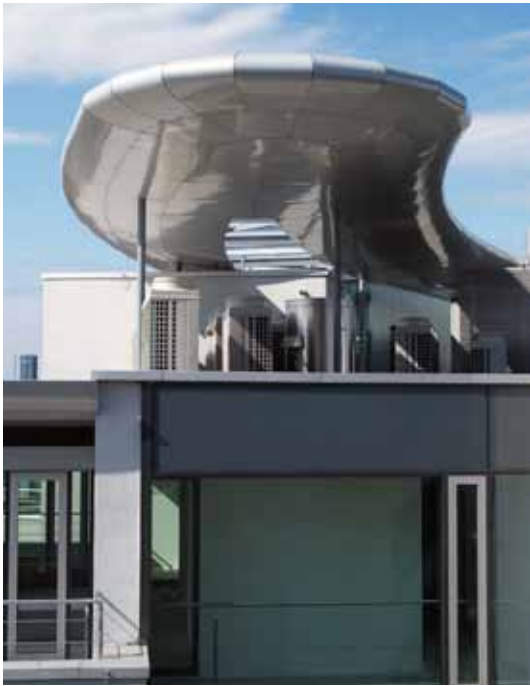
■ MK 2 Flieger Frankfurt a. M. Flugdach