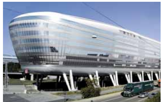
■ THE SQUAIRE Frankfurt a. M