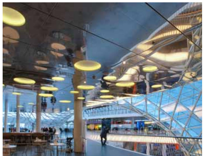
■ MyZeil Spektakuläres Shoppen und Genießen auf der Zeil in Frankfurt