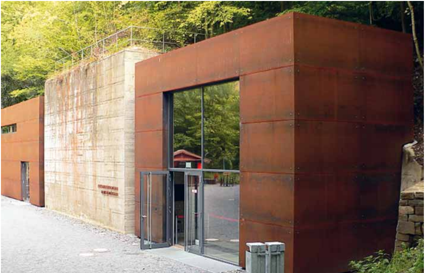
■ Regierungsbunker Bad Neuenahr-Ahrweiler